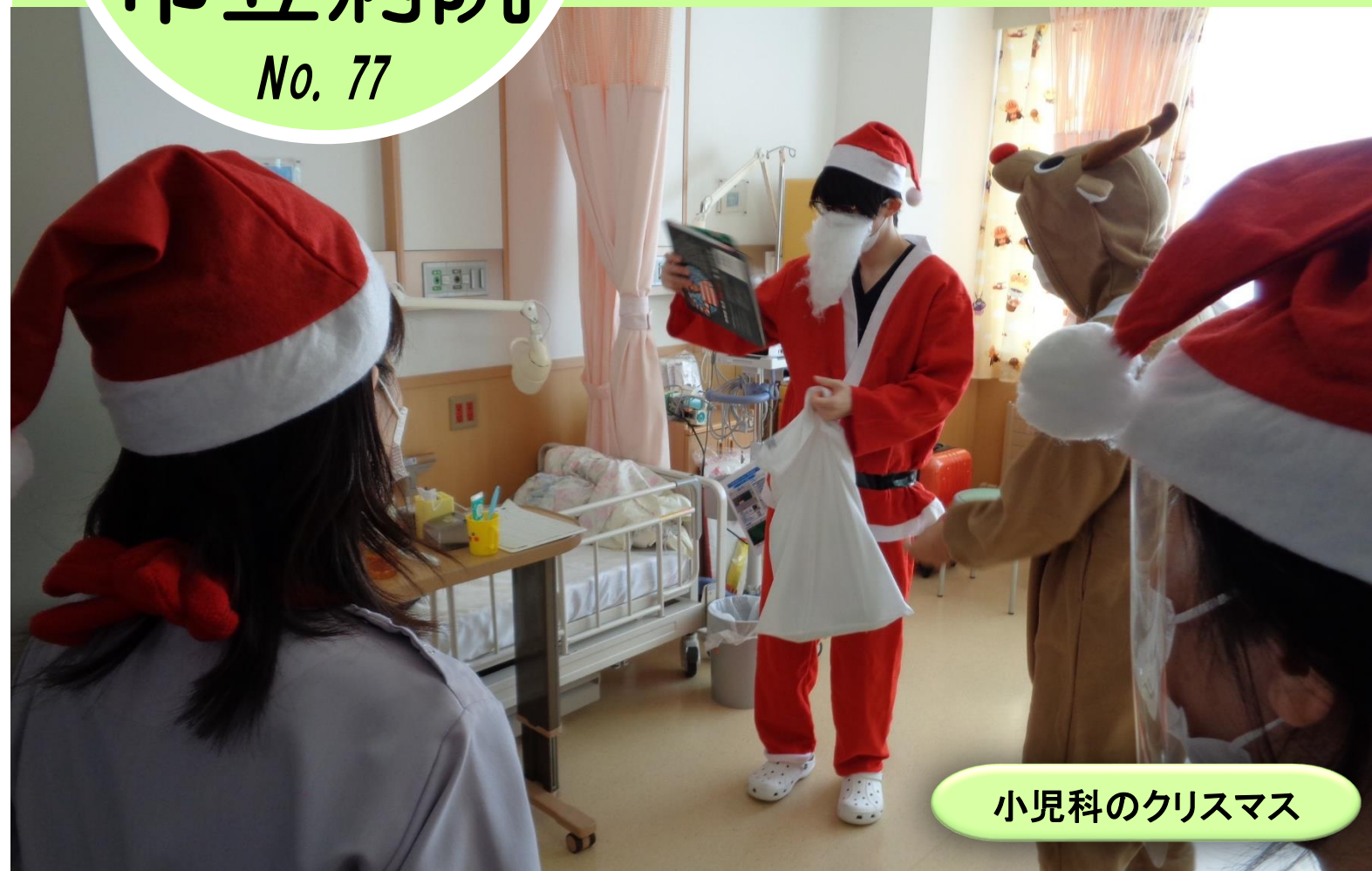
小児科のクリスマス

さて、毎年1月から3月は季節性のインフルエンザの流行時期となります。感染対策の徹底を継続し、体調管理に気を付けましょう。